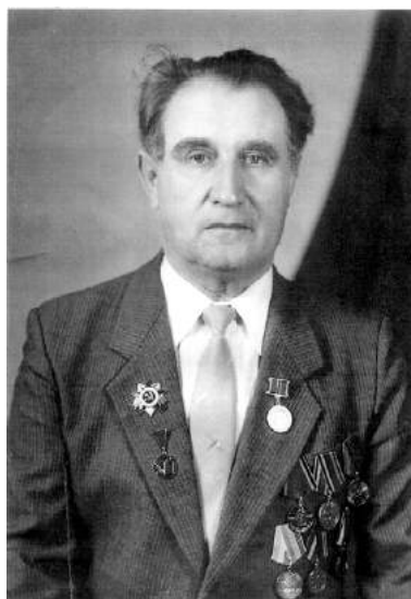
Яків Абрамович Ройтберг (1925–2007).