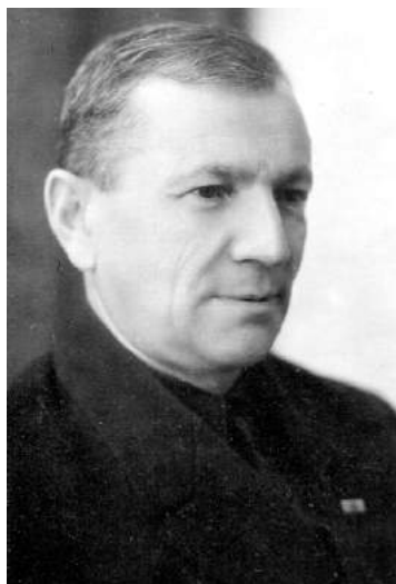
Б.М. Гольденберг (1888–1968).