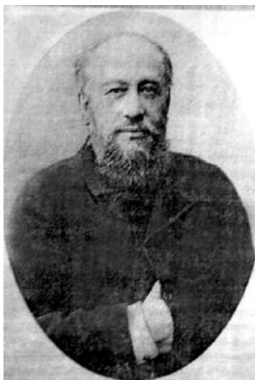
Лазар Ізраїлович Бродський (1848–1914)