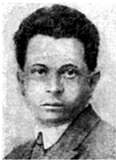
Зіновій Віленський (1899–1984)