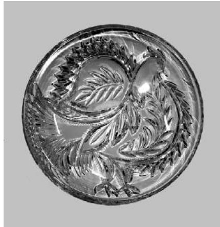
Блюдо «Мир нашій планеті». 1987 р.