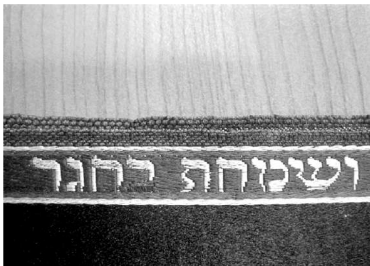
Фартух. ЧІМ. Інв. № Вв-760.