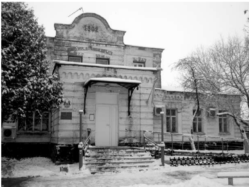
Корюківка. Лікарня, збудована коштом Л.І. Бродського.