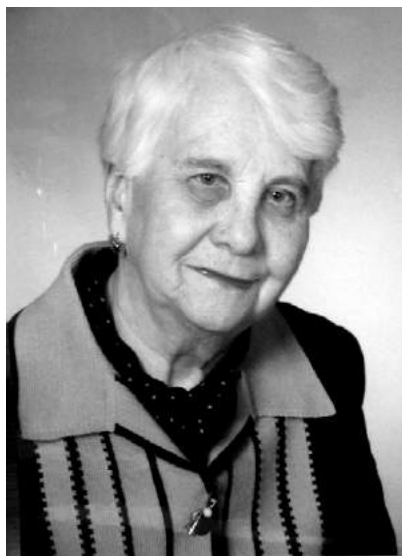
Л.М. Кудрявцева (1924–2010).