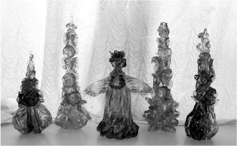
Декоративна композиція «Мальви». 1980-ті.