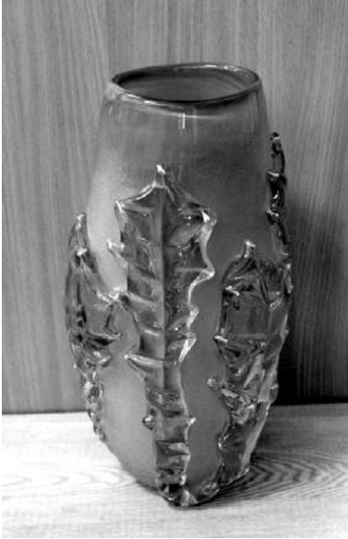
Ваза «Ранок». 1985 р.