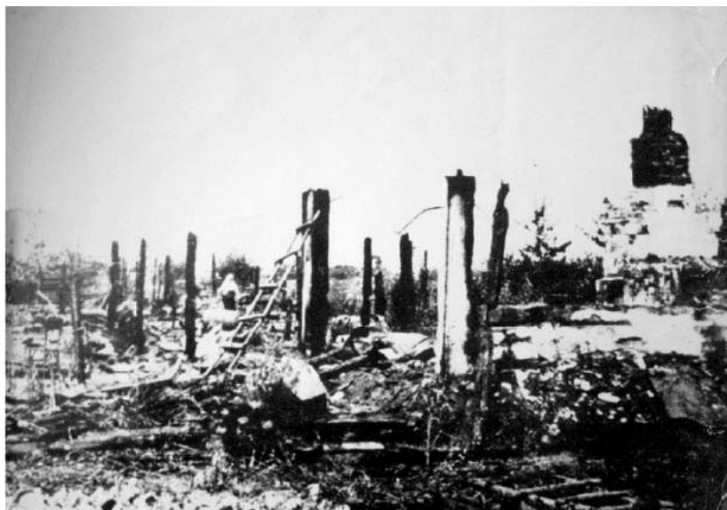
Спалена Корюківка. Березень 1943 р.