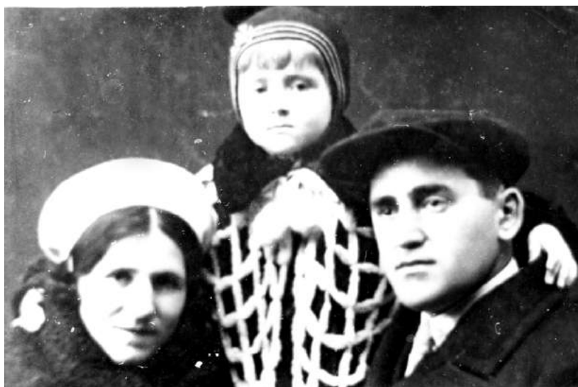
Родина Левіт. 1940 р.