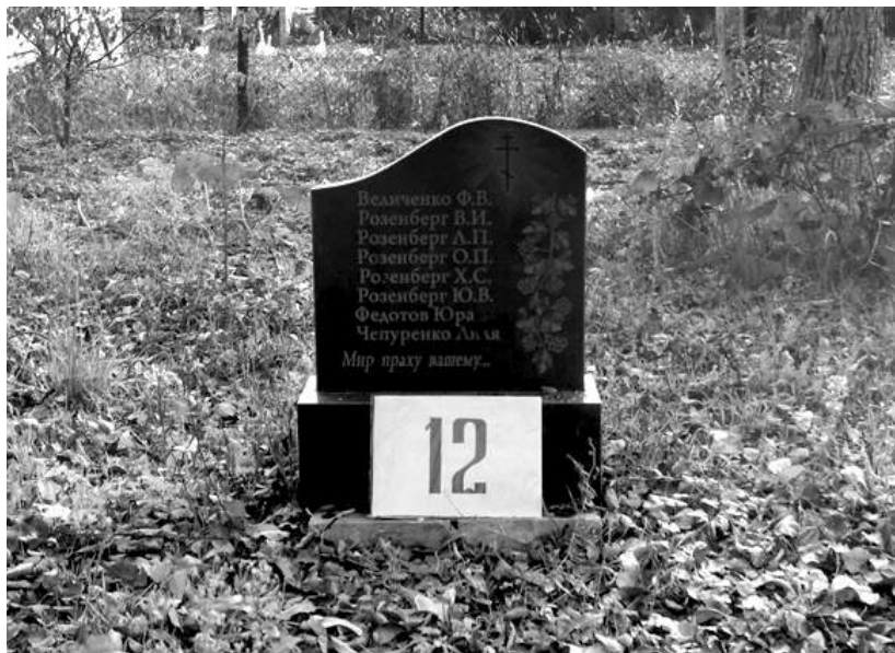
Корюківка. Пам'ятник загиблим у березні 1943 р., вул. Дачна